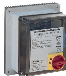
TMVSOL 5/6 - 96/1000